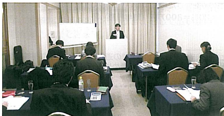
平成23年6月3日(金)~4日(土) 第24期 経営計画発表会 XIV鳥羽にて