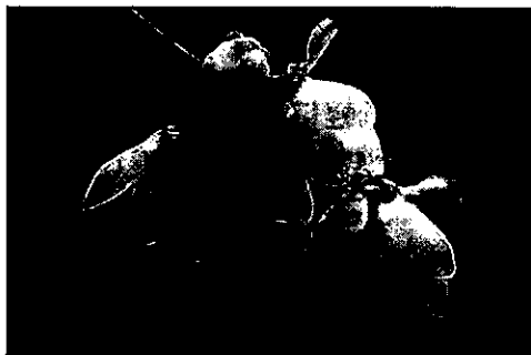
1月の花 罌粟(ロウバイ)